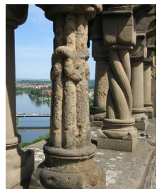
Bad Wimpfen, Kaiserpfalz