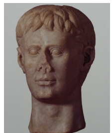
Kopf aus Lanuvio, 13. Jh.