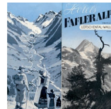
Prospekt Fafleralp, 1944